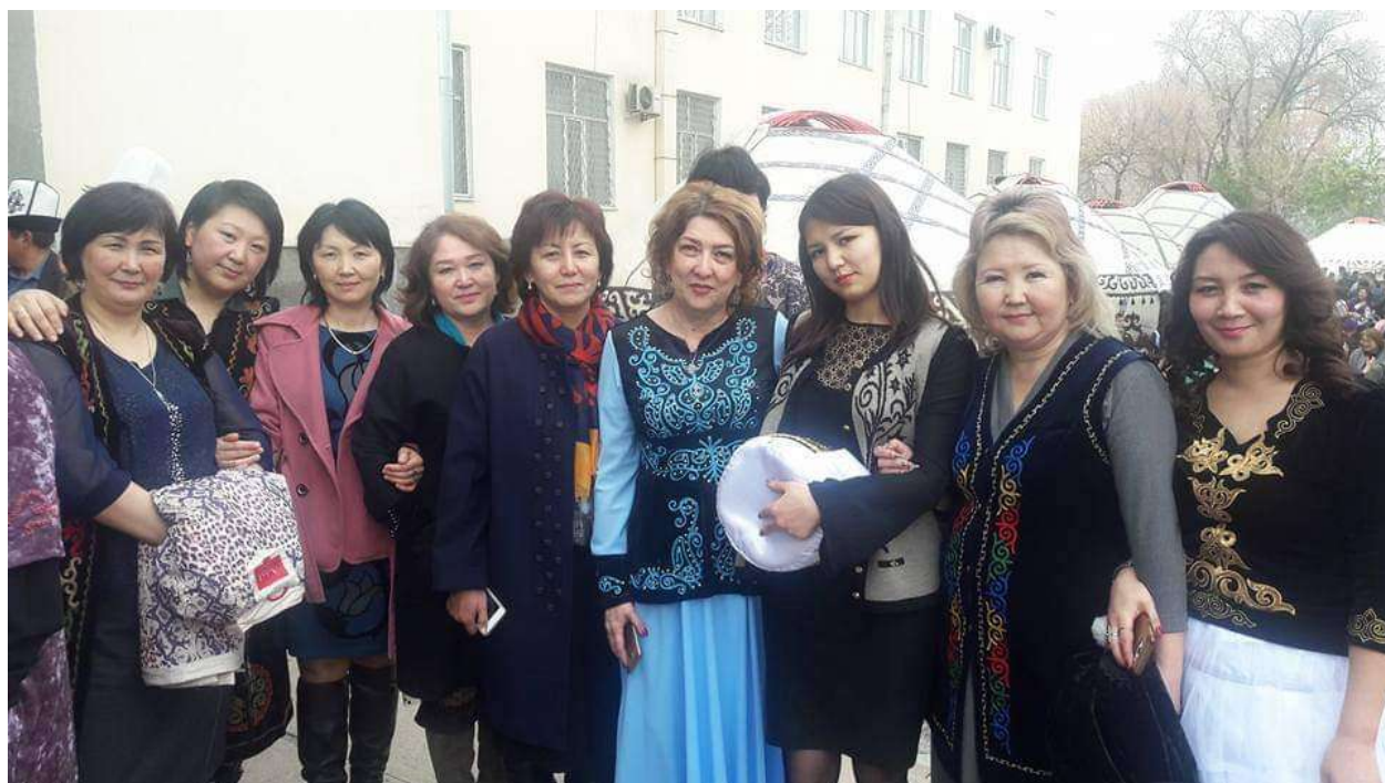
Нооруз - жаздын жана кайра жаралуунун майрамы.