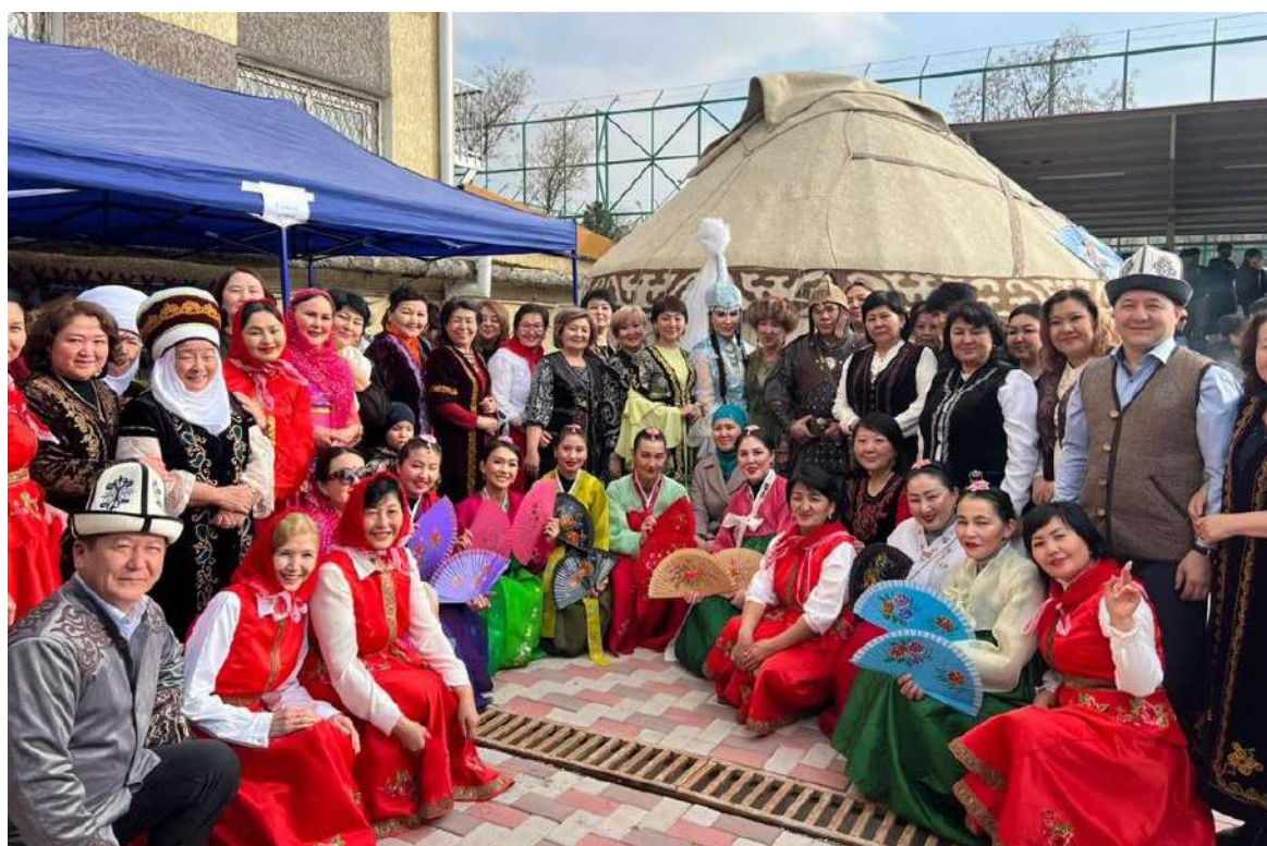
Нооруз - аруулуктун, жаңылануунун жана тазалыктын майрамы