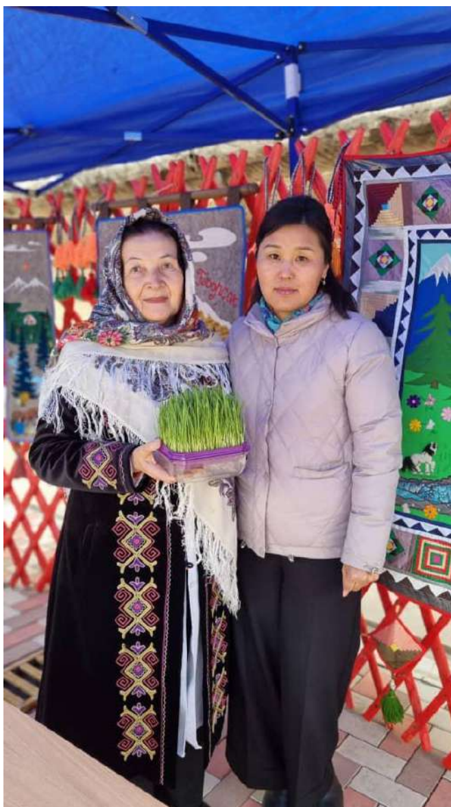
Нооруз жаңы күндүн, жаңы жылдын башаты