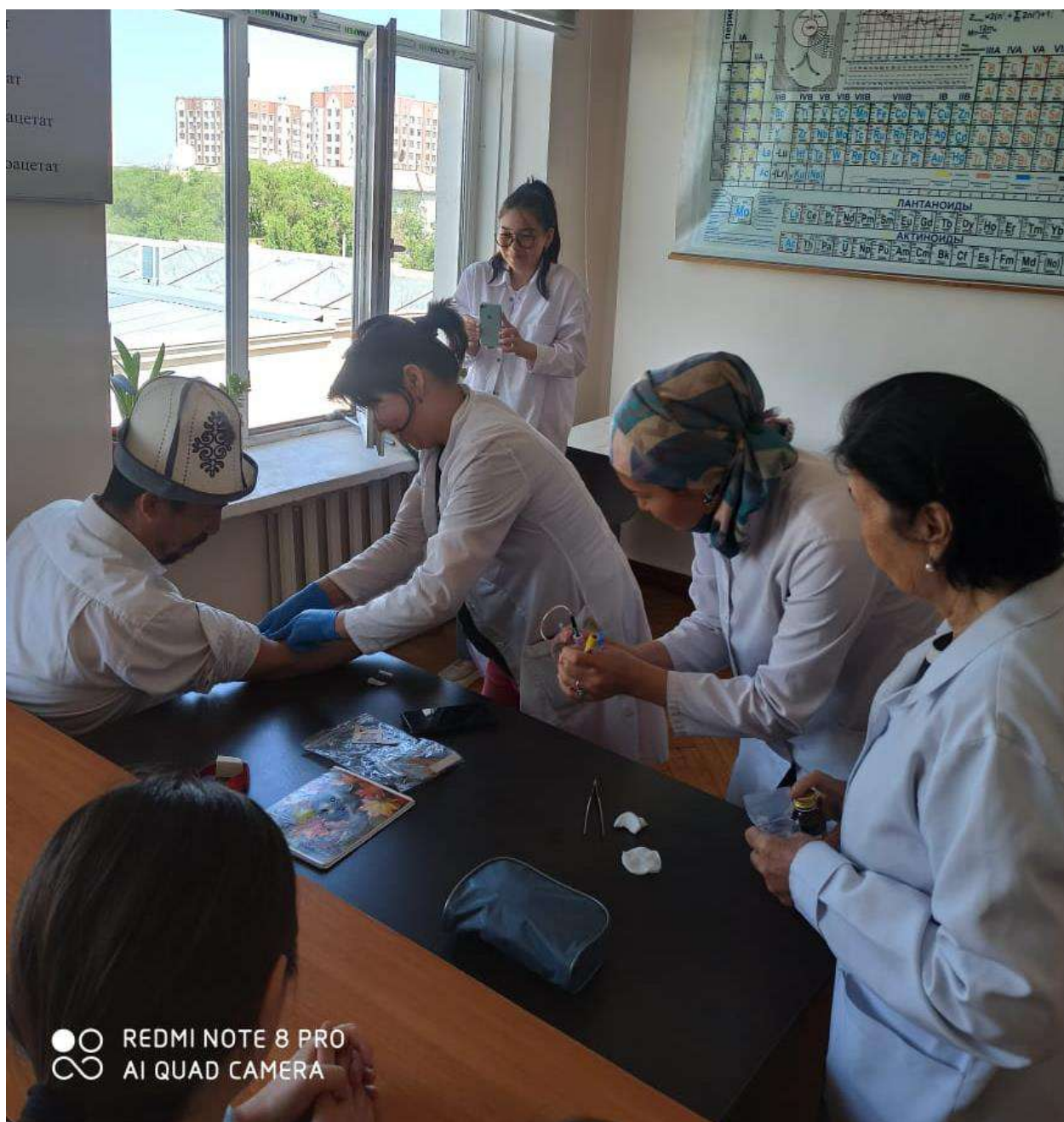
Кафедрада "Манас" эпосун сактоо, изилдөө жана кеңири жайылтуу иш чарасы. Студенттер «Манас» эпосунан үзүндүлөрдү угушуп, илимий изилдөө жүргүзүлдү.