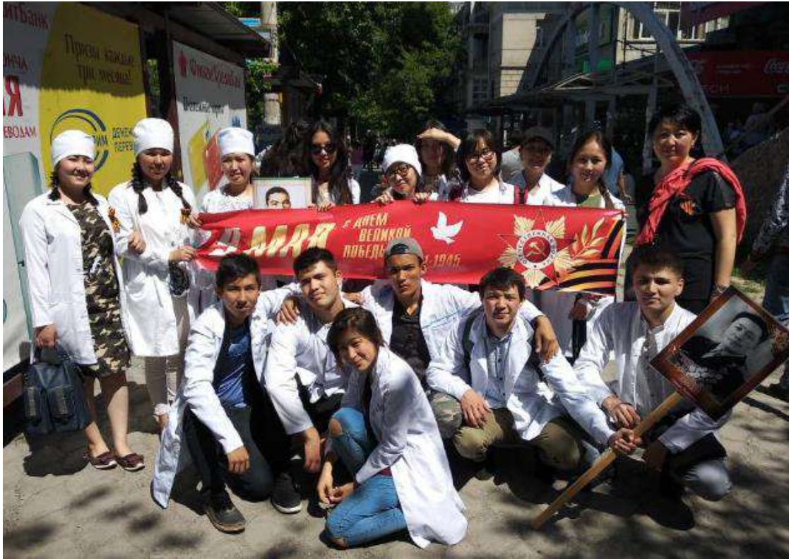
9-май Улуу Жеңиш күнүнө карата өчпөс полкко катышуу