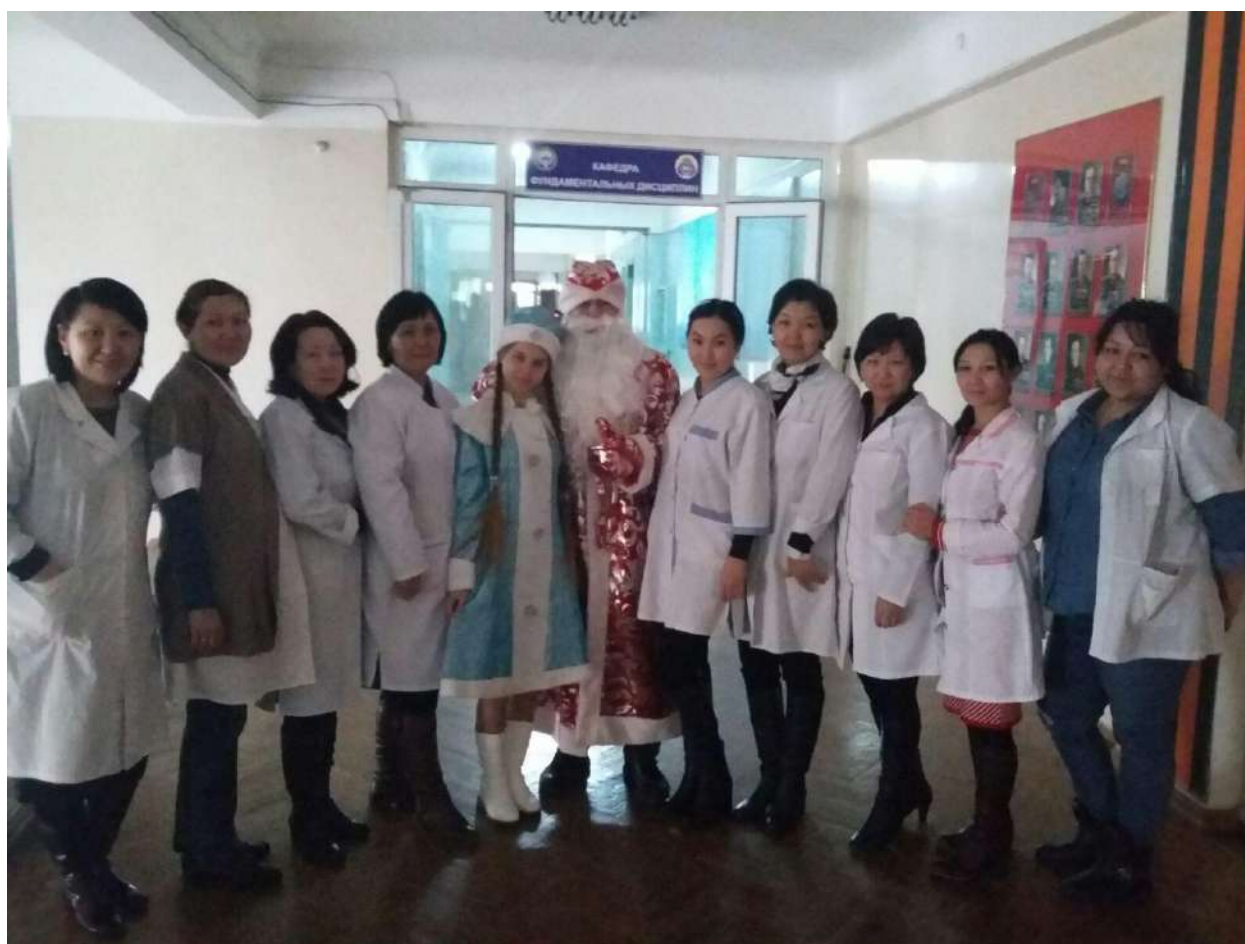
Кафедрадагы жаңы жылдык маанай