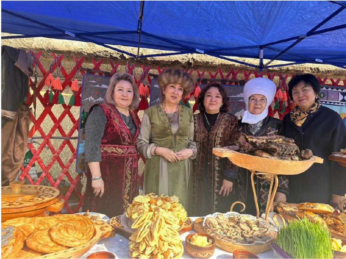
Кут толгон Нооруз майрамы