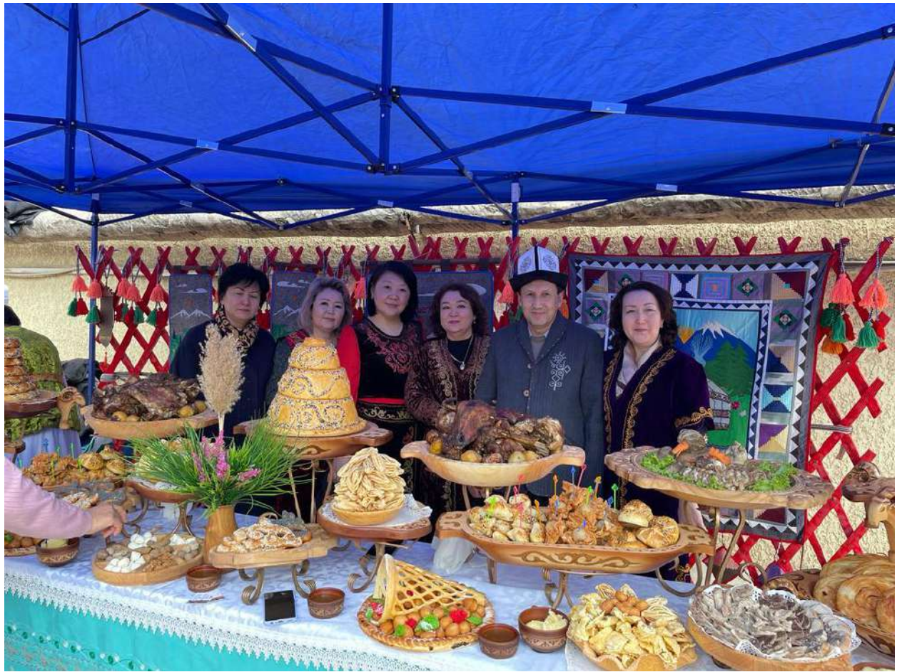
Кыргыздын улуттук сый тамактары