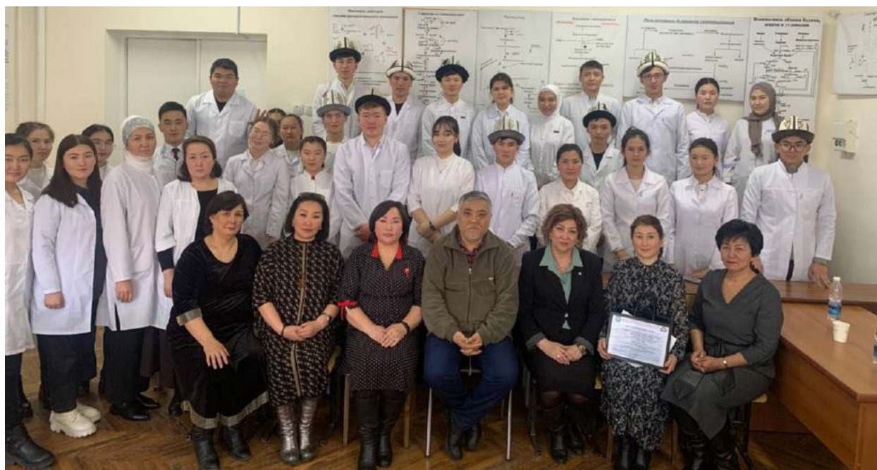
«Тилим барда улутмун, тилим менен улукмун» баарлашуу кечеси 1-курстагы дарылоо иши факультетинин 1, 2, 3, 36-тайпанын студенттеринин катышуусунда өттү