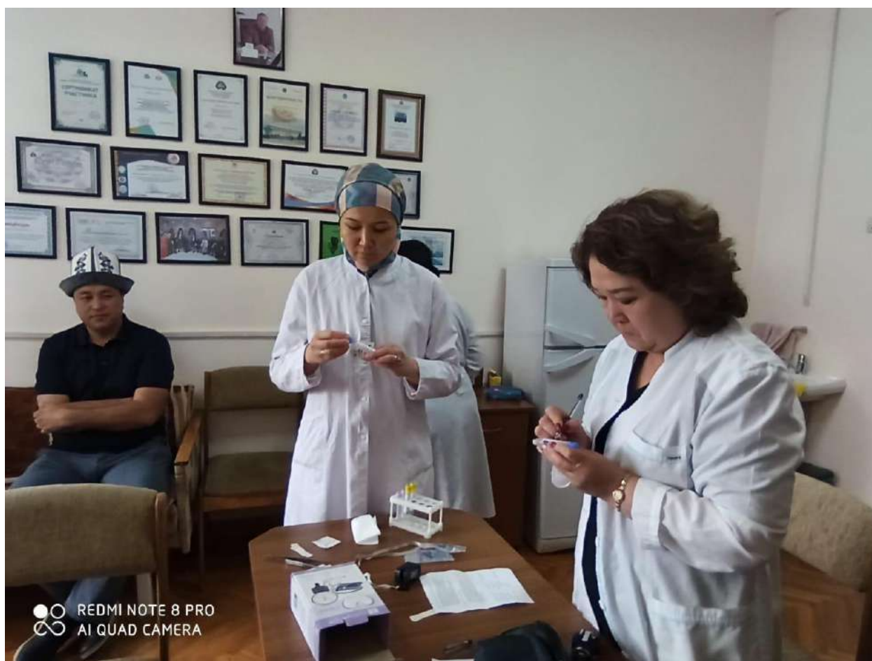
Кафедрада манасчылардын Манас айтуу учурунда биохимиялык өзгөрүүлөрдү изилдеп келишет.