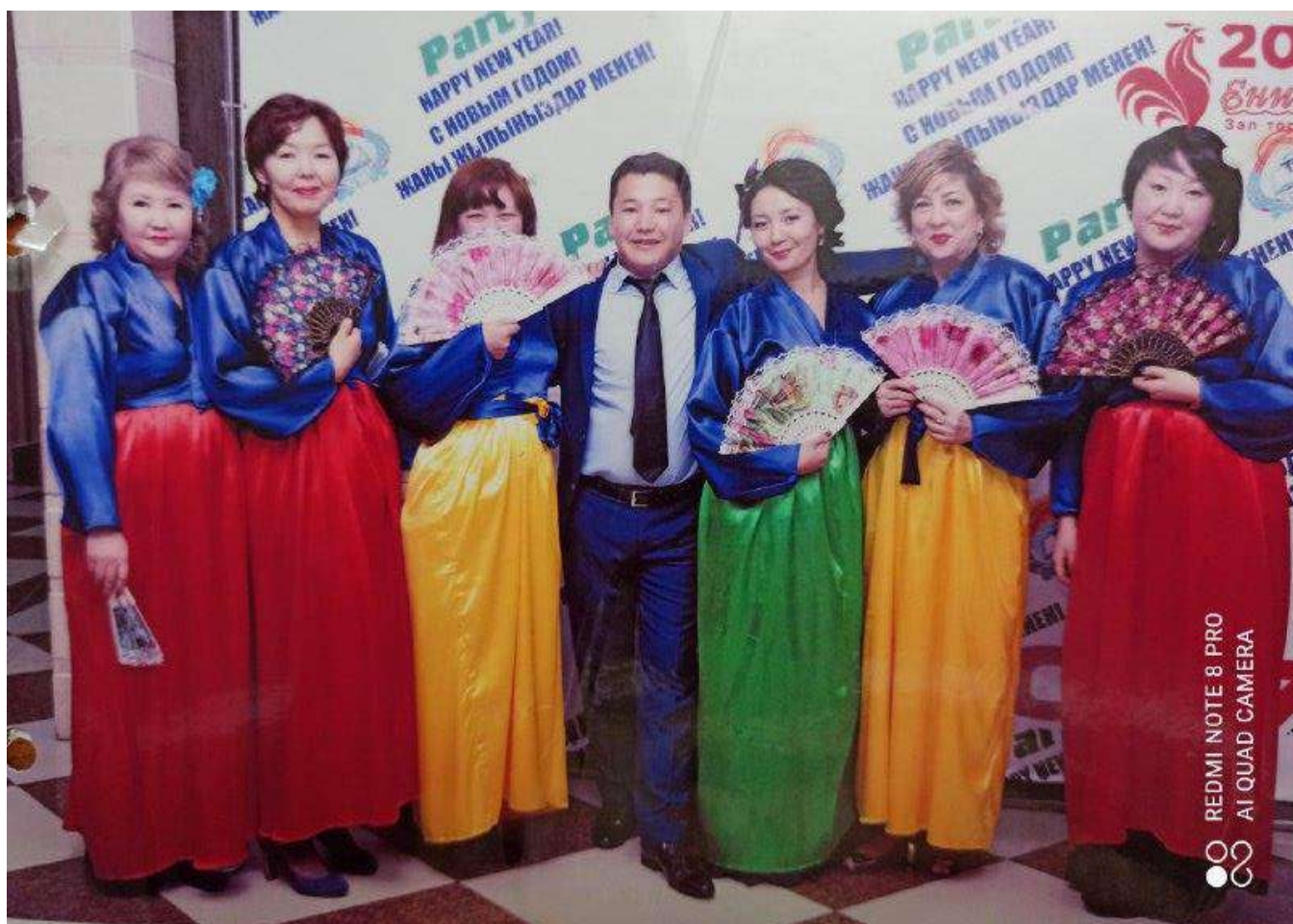
Кафедранын айымдары Нооруз майрамында «Хан сарайдын бермети» аттуу корей элдик бий менен көрүүчүлөрдүн маанайларын көтөрүп, байгелүү орунду жеңип алышты.