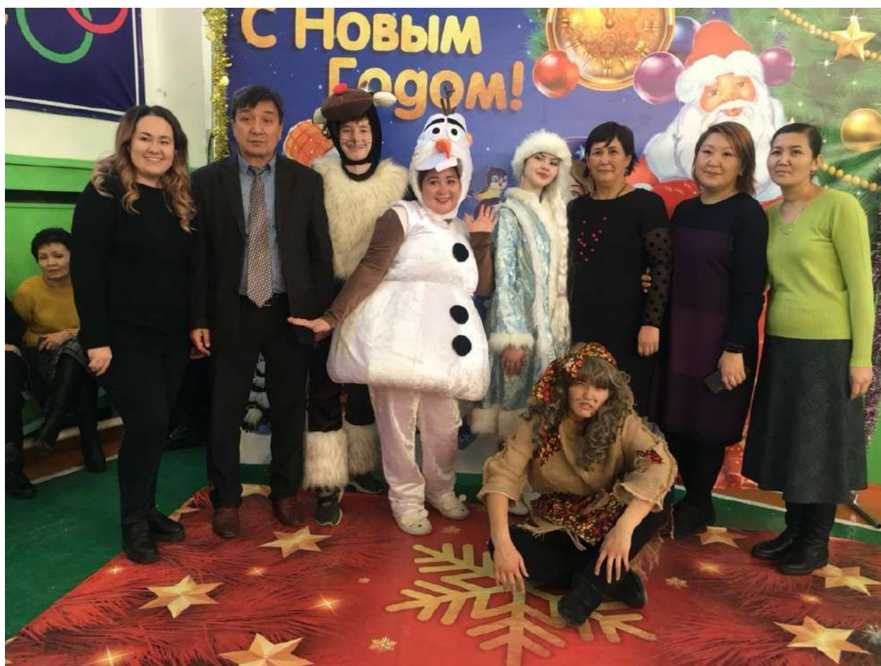
КММАнын кызматкерлеринин балдарына арналган «Жаңы жылдык балаты»