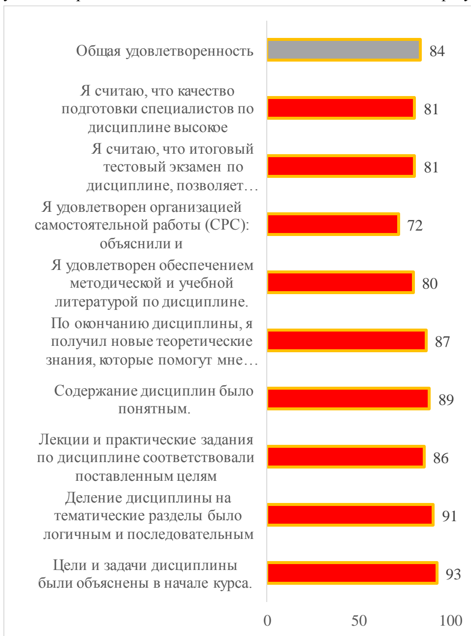
Рис. 1. Результаты оценки удовлетворенности студентов факультета Педиатрия КГМА им. И.К. Ахунбаева качеством учебных программ в 2017-2018 учебном году.

81% опрошенных студентов удовлетворены итоговым контролем знаний и считают, что его объективным и прозрачным. Также, отмечена высокая удовлетворенность качеством подготовки специалистов на факультете – 81%.