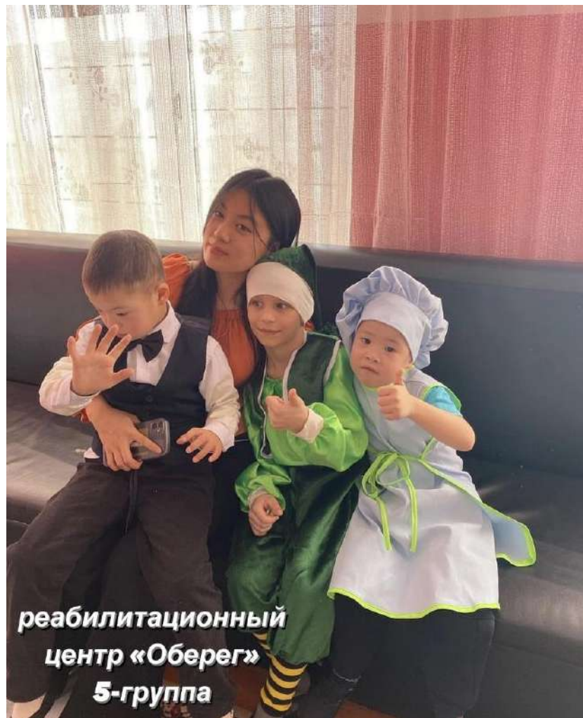
реабилитационный центр «Оберег» 5-группа