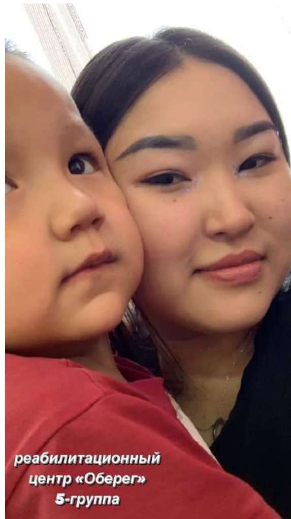
реабилитационный центр «Оберег» 5-группа

реабилитационный центр «Оберег» играли с детьми, проводили интересные интерактивы, поздравили с новым годом, весело провели время