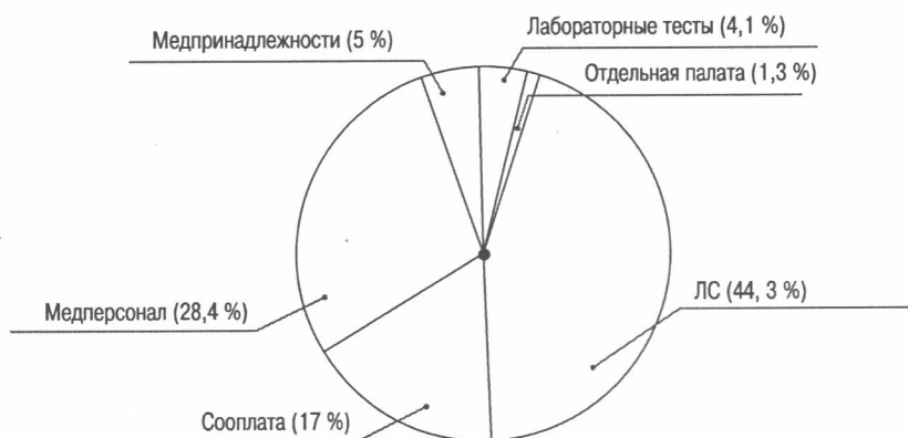
Рис. 1. Доля затрат пациентов в стационаре

Данные рис. 1 свидетельствуют о том, что в случае госпитализации среди выплат из кармана паци-